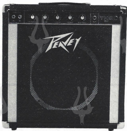
TKO Bass Amplifier (50W R.M.S.) ¥95,000