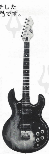
Electric Guitar T-60(with Case) ¥180,000