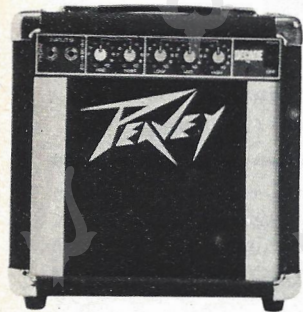
DECADE Guitar Amplifier (10W R.M.S.) ¥45,000

クオリティーのピービーがおくる、小型ギターアンプ。 ¾インチ(約20mm)の頑丈なキャビネットにマウントされた、10インチ・ヘビー・デューティ・スピーカーが、 W(R.M.S.)のパワーを炸裂する。 又、プリ&ポスト・ゲインコントロールが装備となり、3バンドイコライザーは、あらゆる音の要求を フレキシブルにレスポンスする。 そして、コンテンポラリー・ギタリストが、長い間求め続けていた、あのチューブ・サウンドを「サチュレーション T.M. 」により見事に再現します。(特許申請中) バックステージのみならず、オンステージ・パフォーマンスにもマッチした プラクティス/レコーディングアンプ……それが「バック・ステージ T.M. 」です。